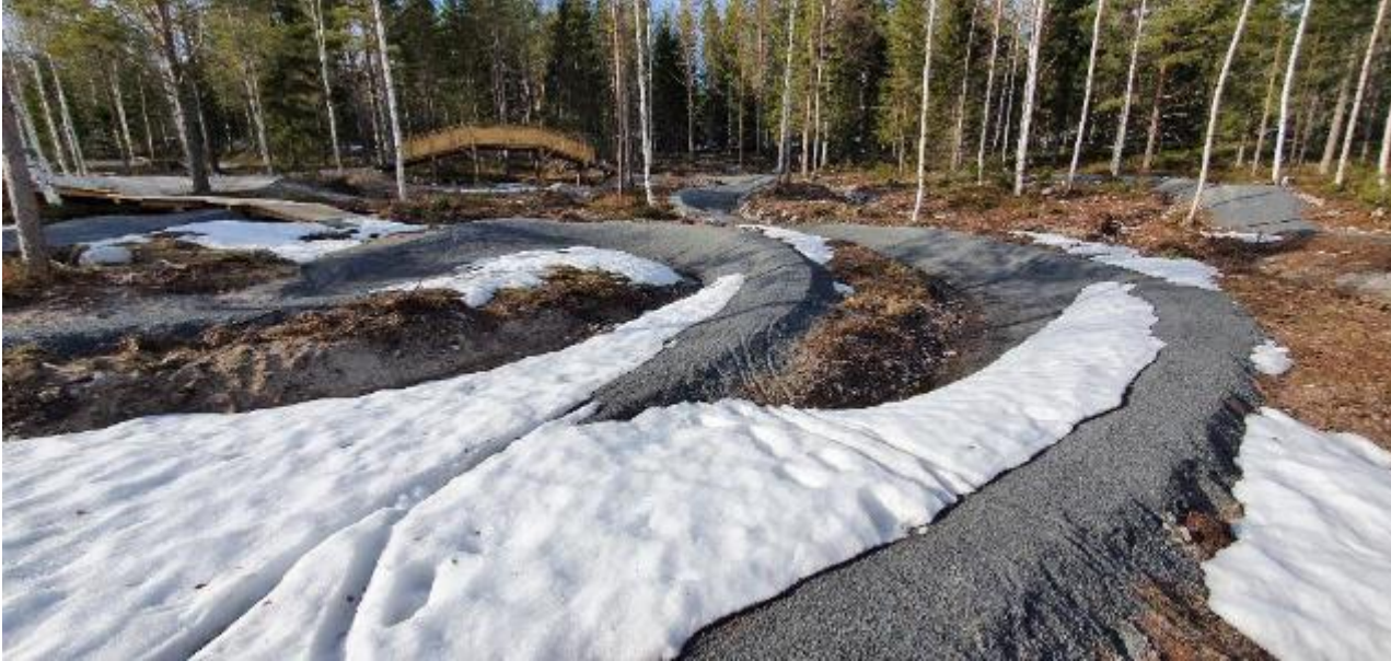
Arenan tinar fram i april